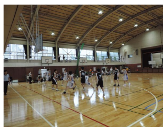
ゴール下のせめぎあいから見事にシュート！