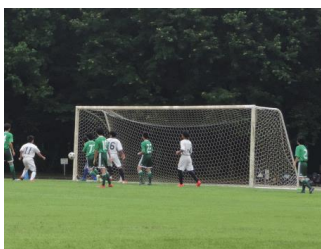
セットプレーからの美しいゴール。入間川中とのコラボレーション炸裂。

保護者の皆様には、各会場で温かいご声援と励ましをいただきました。心より感謝申し上げます。