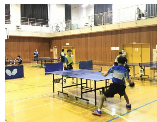
団体戦の様子。緊張感あふれる中でも安定したプレー。