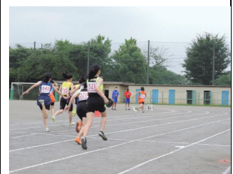
2走から3走へ。混戦のはるか前を疾走し見事1位へ。